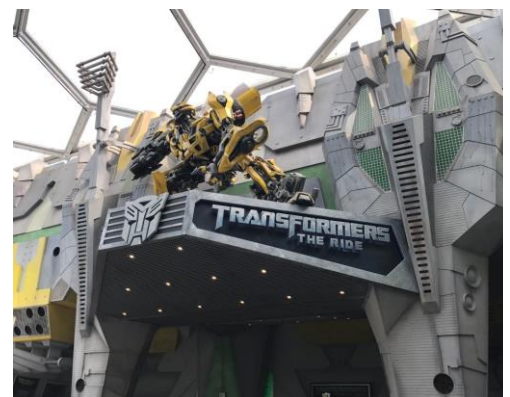
トランスフォーマー・ザ・ライド

また、「USJと同じアトラクションでも、乗り物や内容が少し違うので、楽しめると思います。」「USJにはないアトラクションが体験でき面白かった。」という口コミにもあるように、アトラクションの内容をUSJとUSSで比較してみるのも楽しいかもしれません。