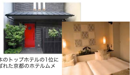
日本のトップホテルの1位に選ばれた京都のホテルムメ