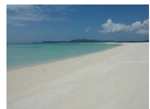
上) 与那覇前浜ビーチ 下) はての浜